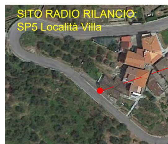
SITO RADIO RILANCIO SP5 Località Villa