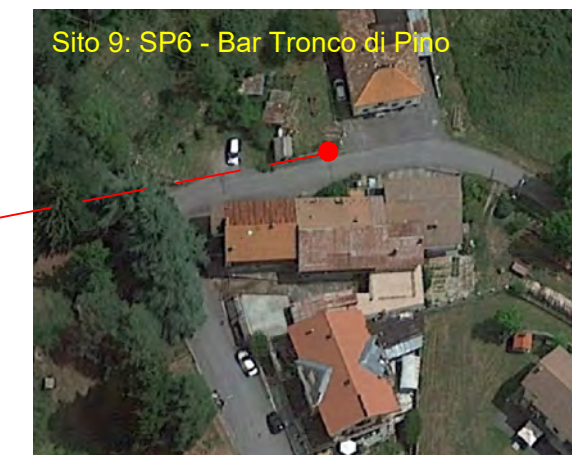
Sito 9: SP6 - Bar Tronco di Plio