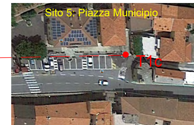
Sito 5: Piazza Municipio