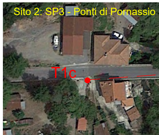
Sito 2: SP3 - Ponti di Pornassio