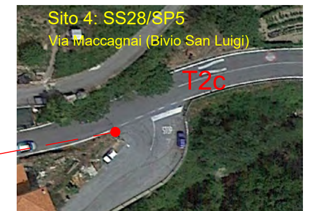
Sito 4: SS28/SP5 Via Maccagnai (Bivio San Luigi)