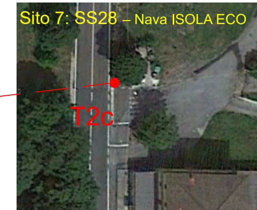
Sito 7: SS28 - Nava ISOLA ECO