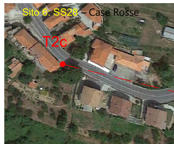
Sito 0: SS28 - Case Rosse