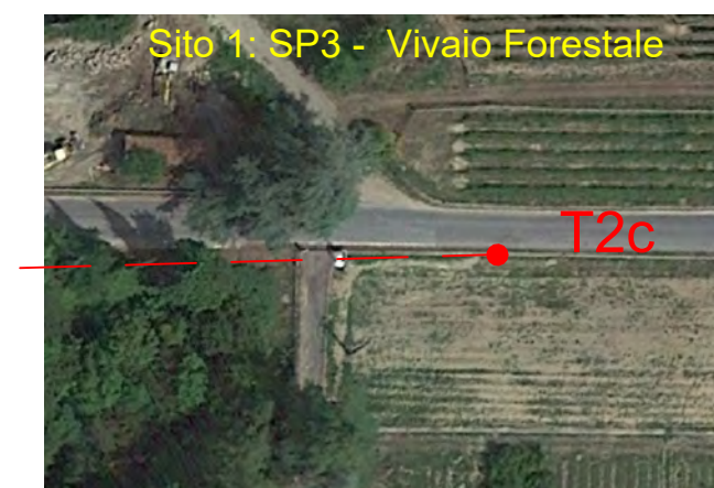
Sito 1: SP3 - Vivalo Forestale