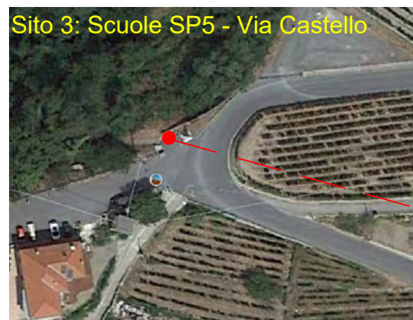
Sito 3: Scuole SP5 - Via Castello