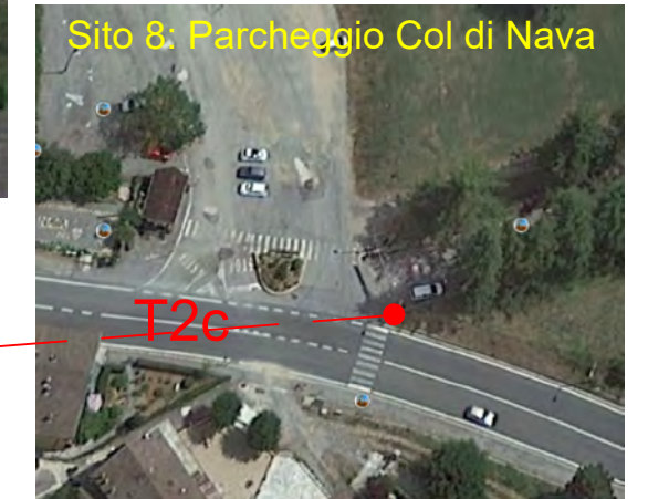
Sito 8: Parcheggio Col di Nava